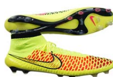
サッカーシューズ