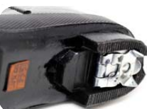
折りたたみ式スパイク