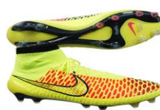
サッカーシューズ