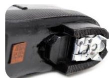
折りたたみ式スパイク